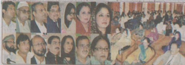
اس ایجنڈہ ویلڈ ویلڈ ایجنسی کے وفد کے ساتھ قومی کانفرنس سے دو روزہ کا خطاب کرانی (اسٹاف ریپورٹر) صوبائی وزیر برائے ترقی نسوان اور خصوصی تعلیم ریویہ قائم ٹائی نے کہا ہے کہ منظور اور ایسی مساوی حقوق دلائے جائیں گے اور قانون سازی کی جائے گی اس حوالے سے سرکاری تجویز قانون کا مسودہ تیار کیا ہے جو اجابت جاسے جس کو ملازمہ آگلی میں پیش کیا جائے گا اور منظور ہونے کے بعد اس پر عملدرآمد کے لیے بھی اقدامات کیے جائیں گے۔ ان خیالات کا اظہار انہوں نے سوسائٹی ویلڈ ویلڈ ویلڈ ایجنسی اور گینٹی ویلڈ ایجنسی کے وفد کے ساتھ ہونے والے اجلاس کے دوران کیا۔

خصوصی افراد کیلئے قانون سازی اور منتخب یونینوں میں سندھی کمیٹی کے سرگرمیوں پر اس ایجنڈہ ویلڈ ویلڈ ایجنسی کے وفد کے ساتھ قومی کانفرنس سے دو روزہ کا خطاب کرانی (اسٹاف ریپورٹر) صوبائی وزیر برائے ترقی نسوان اور خصوصی تعلیم ریویہ قائم ٹائی نے کہا ہے کہ منظور اور ایسی مساوی حقوق دلائے جائیں گے اور قانون سازی کی جائے گی اس حوالے سے سرکاری تجویز قانون کا مسودہ تیار کیا ہے جو اجابت جاسے جس کو ملازمہ آگلی میں پیش کیا جائے گا اور منظور ہونے کے بعد اس پر عملدرآمد کے لیے بھی اقدامات کیے جائیں گے۔ ان خیالات کا اظہار انہوں نے سوسائٹی ویلڈ ویلڈ ویلڈ ایجنسی اور گینٹی ویلڈ ایجنسی کے وفد کے ساتھ ہونے والے اجلاس کے دوران کیا۔