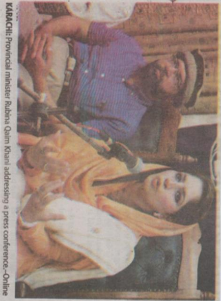
KARACHI: Provincial minister Rubina Qaim Khani addressing a press conference.