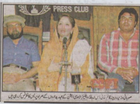
صوبائی وزیر برقی و سوا نے اقوام متحدہ کے کوشش میں قومی مفاد کو اور اسٹیک ہولڈر سمیت روایت قائم ثنائی نے کہا ہے کہ معذور افراد کو مساوی حقوق دلائے کیلئے قانون سازی کی ضرورت ہے اس حوالے سے مجوزہ قانون کا ڈرافٹ دو سال کی محنت کے بعد تیار کر لیا گیا ہے اور اس کانفرنس میں مختلف ممالک اور پاکستان میں بین الاقوامی ماہرین نے شرکت کر کے