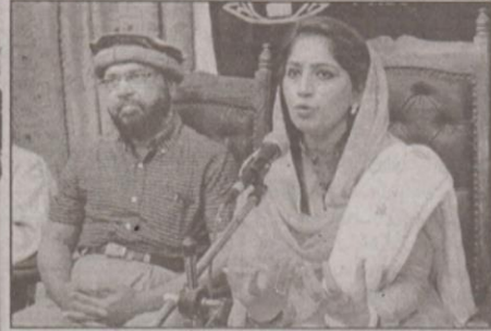
کراچی ہذا صوبائی ذریعہ مساجد قائم ثانی پریس کانفرنس سے خطاب کر رہی ہیں