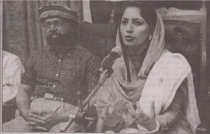
KARACHI: Sindh Provincial Minister, Rubina Qaimkhani is seen addressing a press conference at the Karachi Press Club.