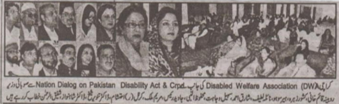
کراچی (پ ر) سماج سے کے خصوصی افراد کے کے سادی حقوق کیلئے جلد قانون سازی کی جائے گی اس کے ساتھ ساتھ خصوصی تعلیم و تربیتی سہولیات فراہم کرنے کے لئے بھی حکومت کو متاثر کرنے کی ضرورت ہے۔