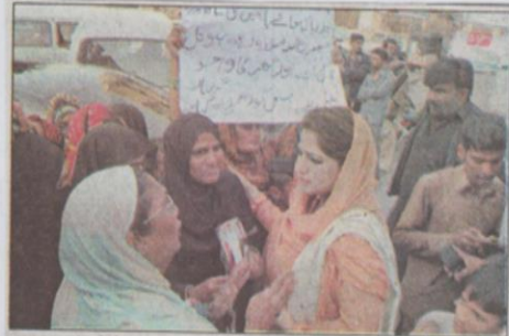
صوبائی وزیر روپیہ قائم خانی پریس کلب پر مظاہرہ کر نیوالی خواتین سے گفتگو کر رہی ہیں

جلد نمبر 17، 19 ربیع الثانی 1436ھ 09 فروری 2015ء صفحات 08 شمارہ نمبر 81