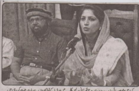
کراچی ہذا صوبائی ذریعہ مساجد قائم ثانی پریس کلب میں پریس کانفرنس سے خطاب کر رہی ہیں